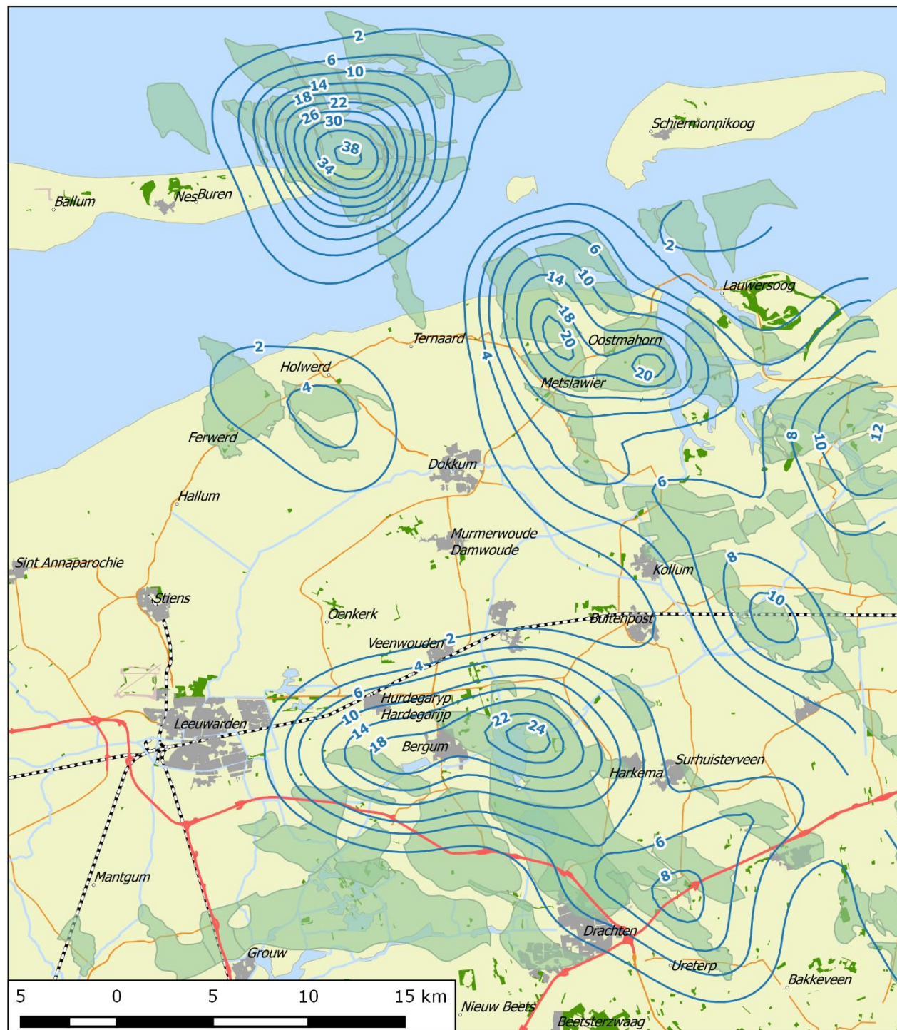
Prognose Bodemdaling door gaswinning 1974 - 2050