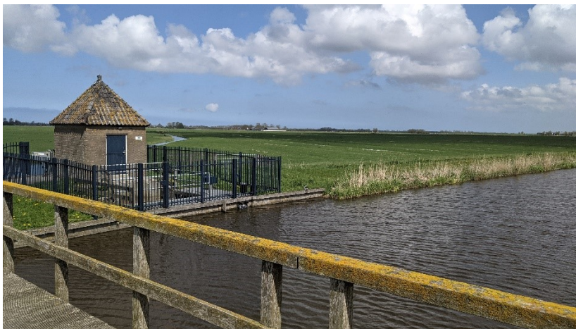
Súd Ie bij Eanjumer Kolken

Samen met het waterschap is CBAF bezig met het opstellen van een methodiek om het verlies aan waterberging als gevolg van bodemdaling door aardgaswinning te compenseren. In de laatste vergadering van 2023 is de commissie door het waterschap bijgepraat op een aantal onderwerpen: opzet van een conceptmethodiek compensatieverlies aan waterberging en de verziltingsproblematiek en de oorzaken daarvan.