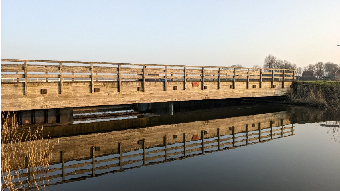
Brug bij Wetsens

In het kalenderjaar 2023 is bij CBAF één melding van een instelling binnengekomen en behandeld met betrekking tot schade aan gebouwen. In dit geval is geoordeeld dat er geen relatie met bodemdaling door aardgaswinning kan zijn. Het betrof hier een melding van een instelling en niet van een particulier. Gebouwschade van particulieren en micro-ondernemingen worden sinds 2021 behandeld door de landelijke commissie Mijnbouwschade (CM). De door de CBAF behandelde schademelding was bij de CM binnengekomen en door hun, omdat het niet binnen hun doelgroep viel, doorverwezen naar CBAF.